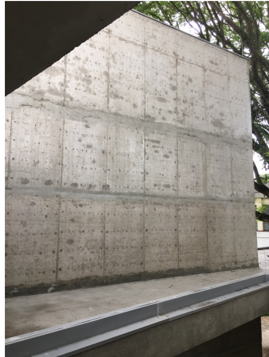
Empena vista do Acesso no 1º andar