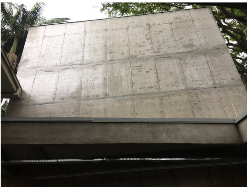
Empena vista do Hall de acesso no Térreo

EM ARQUIVOS SEPARADOS PLANTAS DO PROJETO EXECUTIVO