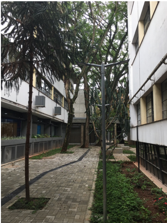
Praça de Ingresso com Empena ao Fundo